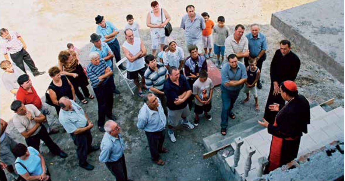
Kardinal Puljić u Srednjoj Slatini 23. srpnja 2004.