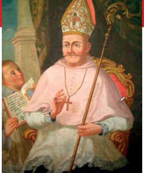
Biskup fra Grgo Ilić Varešanin

Dogodilo se to 20. svibnja 1857., točno 50 godina nakon fra Lovrine smrti. Čak nakon pola stoljeća još jedan je fratar glavu gubio jer se u Bosni, usprkos reformama, ništa nije mijenjalo. Fra Lovro je umro šutke, fra Ivan žustro govoreći ono što sili nije bilo milo čuti. Svatko na svoj način, ali od istog uzroka i za isti ideal: kršćansko ljudsko dostojanstvo.